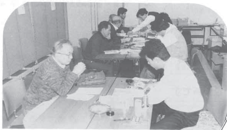
昨年3月の申告（町役場大会議室）