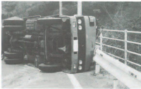
無謀な運転が事故につながります

昨年町内では、物損事故と人身事故を合わせて三百七十一件が発生し、前年に比べて四十七件も増えました。特に子供の傷者の増加及び自転車乗車中の交通事故