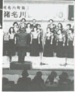
猪名川音楽祭 町商工会青年部主催の猪名川音楽祭が、11月18日日生カリヨンホールで開催され、関西学院大学吹奏楽部が招待演奏しました。その後日団体のアマチュアグループが出演し、日ごろの練習の成果を披露しました。