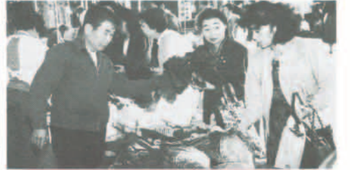
農業祭 11月17・18日に社会教育センター分館などで開かれ、延べ1万2千人が秋野菜や町の特産品の即売会に訪れ、にぎわいました。また、町農産物品評会や木工教室も開かれ、竹とんぼなどを作成し、手づくりの楽しさを味わいました。

たことはありません。特に、一、二歳の子どもの場合、またそれほどもちゃに對する強い関心もなく、自分の体や、その辺にあるものといった確切なもので結構遊べるものです。