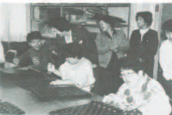
婦人会がユウカリ福祉会を訪問 11月19日に、町婦人会の5名が、授産施設「ユウカリ福祉会猪名川園」を訪問し、同園に役立ててほしいと3万円寄付。また、園生との交流も深めました。