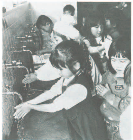
給食前に手を洗う児童たち(松尾台小学校)