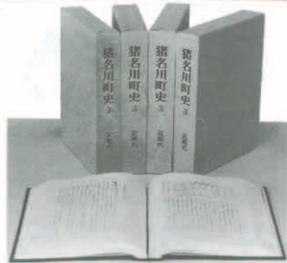
発刊された町史第3巻

町では、このほど「猪名川町史」を第3巻として、昨年三月に発行した。一昨年三月に発行した「猪名川町史」の第2巻(近世編)に続く、近現代編として、明治新政の中心に、猪名川町が現在まで発展を遂げた歴史を、猪名川町史第3巻として、今年三月に発行する。この町史第3巻は、猪名川町史第1巻(近世編)と第2巻(近現代編)と同様に、猪名川町の歴史を、猪名川町の発展を遂げた歴史を、猪名川町史第3巻として、今年三月に発行する。