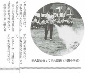
消防訓練の様子。子どもたちは真剣な表情で訓練に取り組んでいます。

3月1日～7日 春の全国火災予防運動 昨年は町内で11件発生 三月一日から七日まで、春の全国火災予防運動が実施されます。この時期は気温が高くなり、火気が燃えやすくなります。火の用心を怠りません。 昨年の火災発生状況は、町内全体的に11件発生しました。主な原因は、調理器具の取り扱いミス、タバコ、お香、ろうそくなどです。