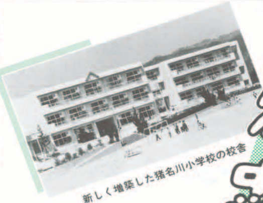
新しく増築した猪名川小学校の校舎

猪名川小学校では、校舎の増築により、現在の十九クラスから将来三十クラス(児童数約一千二百人)の規模まで対応できます。 また、新たに町内小・中学校として、五番目にパソコン教室も設けました。主として図書室など四室、延べ六百七十八平方メートルです。 校舎は、鉄筋コンクリートの三階建てで延べ面積は一千七百七十一平方メートル、事業費は、四億四千九百六十九万九千円です。 ▽普通教室棟(十二室、延べ一千九百三十三平方メートル) ▽特別教室棟(パソコン教室一室、図書室など四室、延べ六百七十八平方メートル)