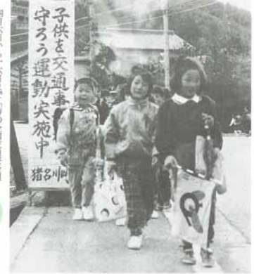
朝の児童たちの登校風景(大島小学校区)

危険な所が いっぱい。大島小学校は、児童の安全確保のために、危険な場所を洗い出し、注意喚起を行っています。