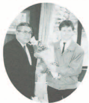
上神町長から激励を受けるアリスター君

私はスポーツをしたり、 音楽を聴くのが好きですが 特に、バレーボール、ゴル フ、チェスが好きです。