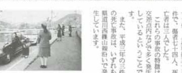
町内の交通 事故の状況

町内の交通 事故の状況。交通事故の発生状況を確認し、子どもを交通事故から守るための取り組みを行っています。