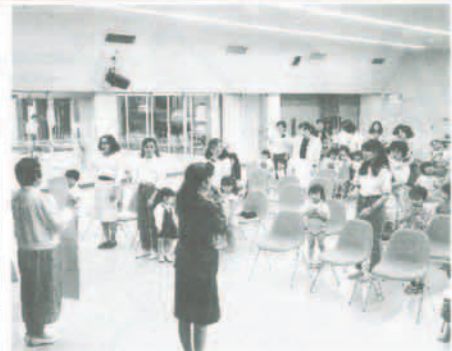
幼児交通安全クラブの発会式

四月の、町内の交通事故件数は十二件で、その内、子どもを巻き込んだ事故は三件ありました。悪質な事故の一つでも減らすために、また子どもたちの笑顔を守りたいために、ドライバーのみなさんは次のことに注意してください。