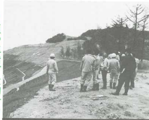
県・警察・消防などと合同で防災パトロールを行いました。