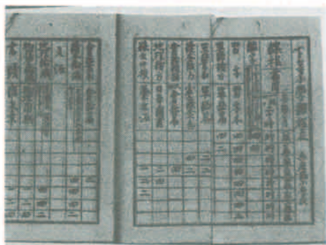
下等小学課程表(中村太門文書)