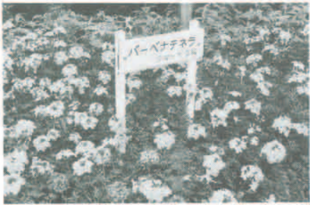
総合公園内に咲く美しい花

四月二十八日にオープンした総合公園は六月に一斉に花の季節を迎えます。利用者であるみなさんから開園まもない総合公園の管理に対する意識のレンゲツツシ、淡紅色あざやかなツツシ科のレンゲツツシ、ヒラドツツシ、サツキやアカネ科のクちなシ、ヒメクちなシの白い花と香り、かわいらしい小花をつけるバラ科のシモツケ、オトギリソウ科のヒペリウムなどがみなさんの来園をお待ちしています。