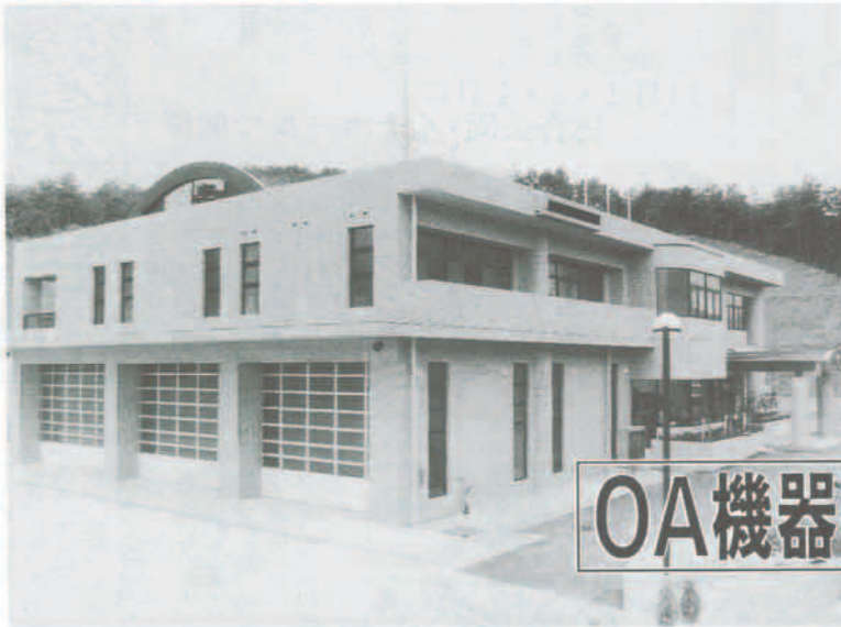
▲消防体制の拠点となる新庁舎

平成2年4月にスタートした町消防本部の新庁舎が9月末に完成しました。この庁舎は、町の総合計画に基づく、6万人の町づくりの一環として、また、本町の消防体制の根幹をなす施設として整備されたものです。この庁舎の主な特徴として、各分団や、自衛消防組織などの訓練用施設を配置しています。合わせて、的確な情報をキャッチして、迅速な対応、処置が取れるように、消防緊急情報システムを導入しています。新庁舎への引越は、9月末日に行い、10月1日から業務を開始します。今月号では、この庁舎のあらましをお知らせします。