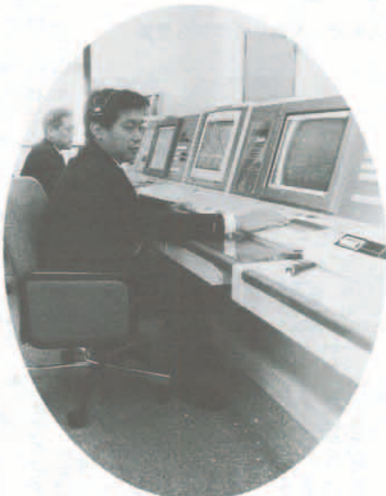
▲災害通報を統括する通信指令室

このシステムは、有線無線の通信網を統制して消防緊急情報の検察処理を迅速・的確にします。なお、竣工式は十月五日を合わせて行います。庁舎内の主な表示は、国際化に伴い日本語と英語の表示を行っています。