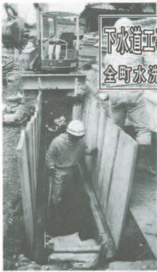
下水道工事進んでいます 全町水洗化をめざして

平成四年度の下水道工事も着実に進んでいます。町では、平成二年度に「ニューティフル猪名川計画(全町下水道計画)」を策定し、平成十三年度末まで全町水洗化を進めています。 これは、町内全域を水洗化率100%にするための計画です。これによって、住民の生活環境の整備を行うと共に、清流猪名川を取りももとうとするものです。