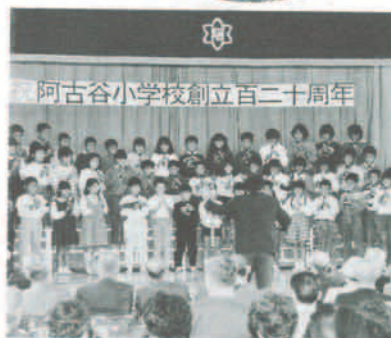
阿古谷小学校創立百二十周年

いながわあんでばんだん展 猪名川美術会が10月29日から11月3日まで、同会の創立5周年を記念していながわあんでばんだん(無審査・無賞)展を開催しました。水彩画、油絵、コラージュなど72点の作品に来場者たちは見入っていました。