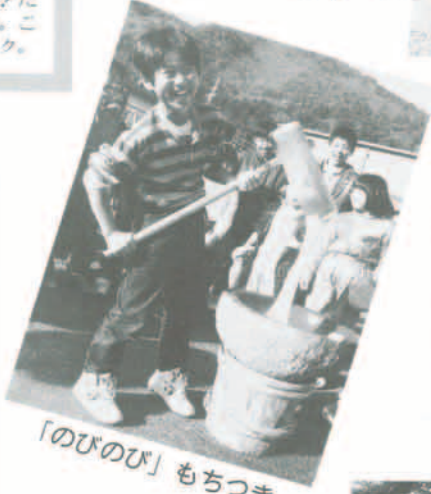
「のびのび」もちつき

12月26日、大崩小学校で楽しいもちつき大会が行われました。児童が自分たちで育て収穫したもち米で、昔ながらの手ネとウスを使い、カニ一杯もちつきをしました。つきあがったおもちには、みんなできな粉もちにして食べました。