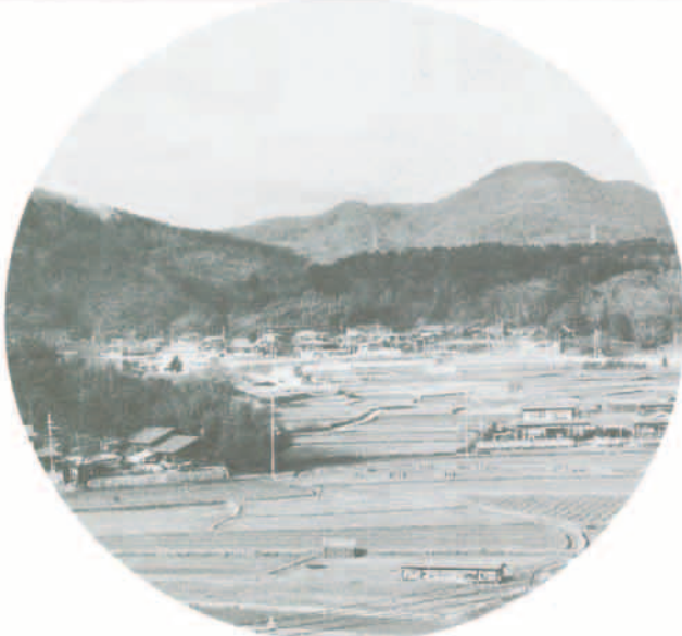
第2名神自動車道の通過が予定されている広根から猪刈地区