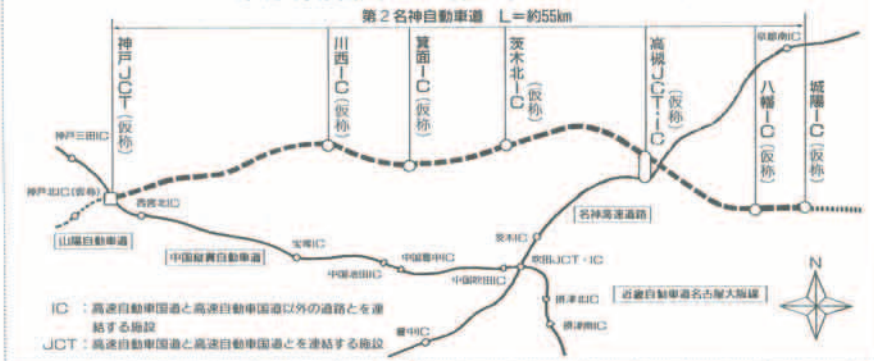
京都府城陽市から神戸市までのルート図

五回開催しますので、出席してください。 第2名神自動車道の計画に伴って、本町役場付近から(仮)川西インターチェンジへのアクセス道路として、(仮)石道上野線を計画しています。