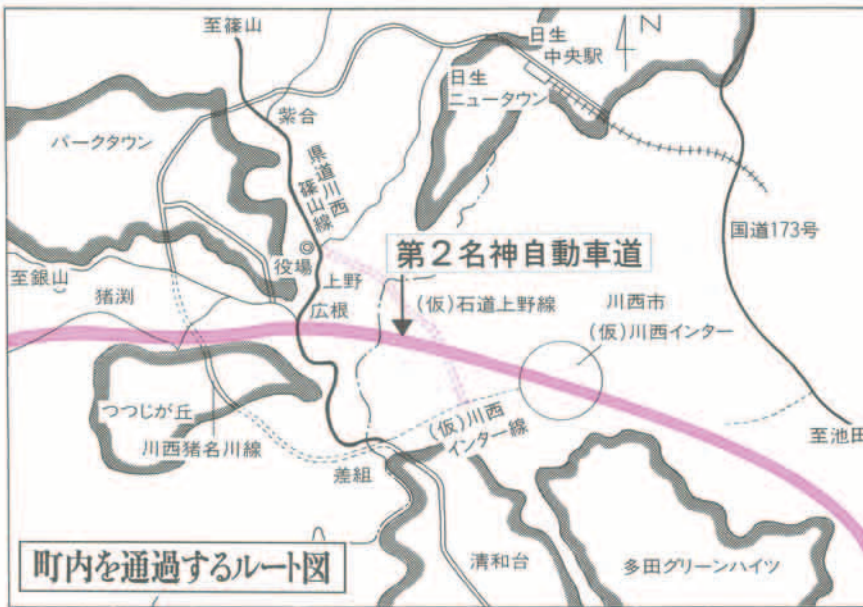
町内を通過するルート図

神戸市の三市一町を通過し、猪刈地区から猪刈川に沿って宝塚市を経て神戸市に至り、中国縦貫自動車道並びに建設中の山陽自動車道に接続します。 この道路は、利用者の利便性と交通の円滑化を図るため、上野地区内の県道川西藤山線と町道原広根線の交差点から東南方向に進み、川西市石道で(仮)川西インター線と接続する幅員十八mの都市計画道路です。