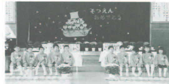
▲最後の卒園式 3月18日、町内5幼稚園で卒園式が行われ、来年度より松尾台幼稚園と統合となる阿古谷幼稚園では、今年で最後となった卒園式に感慨無量でした。