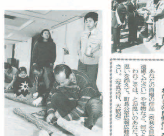
▲家庭でシイタケ栽培を 3月11日日生住民センターでシイタケ栽培講習会が開催され、31名の参加者は、本町の特産品であるシイタケの植菌作業を体験し、大喜びでした。