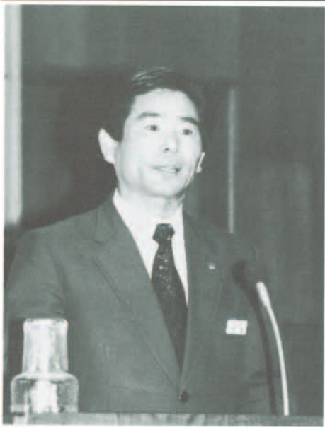
第268回定例議会で施政方針を表明する宮東町長