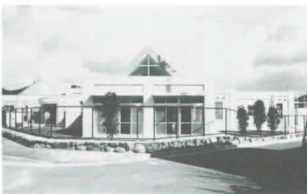
4月から開園する猪名川保育園