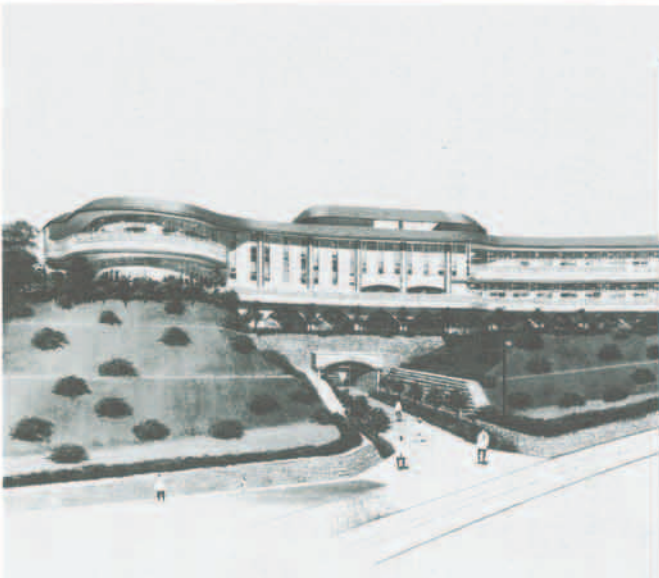
(仮)福祉センター完成予想図