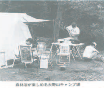
森林浴が楽しめる大野山キャンプ場

「サマーキャンプ」は、町民の夏の楽しみを創出し、自然豊かな環境の中で、家族みんなで楽しむことができます。