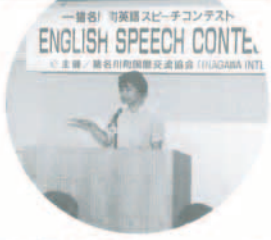
英語スピーチコンテスト ENGLISH SPEECH CONTEST 主催：藤名川町国際交流協会 (TAKANAGA INTL)

「英語スピーチコンテスト」は、町民の英語学習の機会を創出し、国際交流の促進を図ることを目的として開催されています。今年も7月4日(日)に開催予定です。