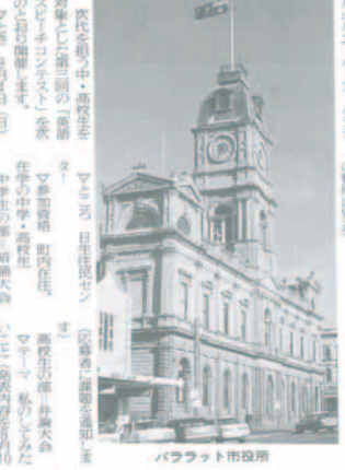
パラフレット市役所

「成長」 成長は、町民の生活の向上を図ることを目的として開催されています。今年も7月11日(日)に開催予定です。