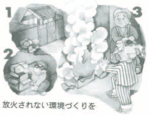
放火されない環境づくりを