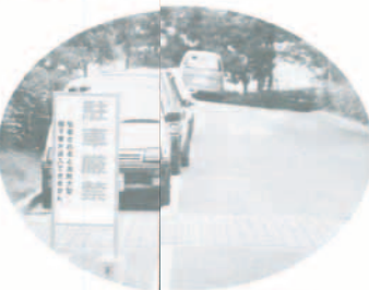
狭い道路での駐車は歩行者の妨げにもなります

その駐車あなたはよくてもみんなが困る。違法駐車は、交通安全の確保を妨げ、歩行者や自転車の安全を脅かします。また、交通渋滞の原因にもなります。