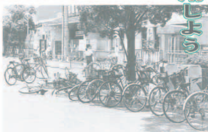
通勤・通学などの自転車は駐輪場へ