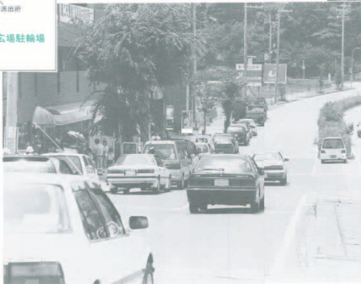
違法駐車が多く見られる都市計画道路川西格名川線（原地内）