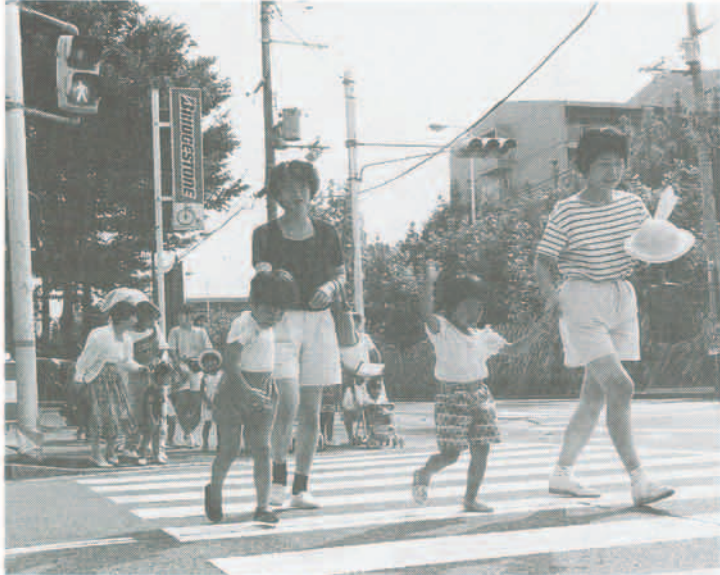
信号の渡り方を学ぶ幼児交通安全教室