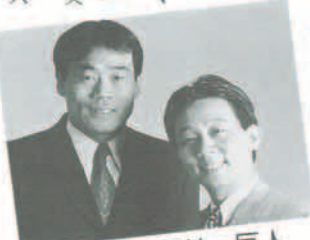
オール阪神・巨人