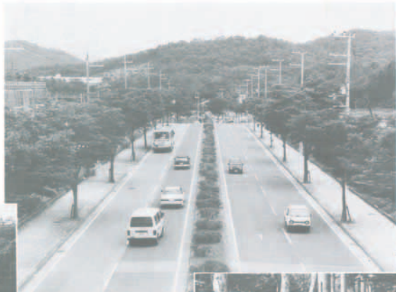
◀道路幅員24mの都市計画道路 川西猪名川線 ▼インターロッキングブロックや低木で整備した歩道

町道の整備は、地域の生活の質を向上させるために不可欠です。町道の整備には、多くの費用がかかります。町道の維持管理もまた、大きなコストがかかります。町道の愛護は、私たちの生活を守るために、一人ひとりが取り組むべき課題です。 町道の整備には、多くの費用がかかります。町道の維持管理もまた、大きなコストがかかります。町道の愛護は、私たちの生活を守るために、一人ひとりが取り組むべき課題です。