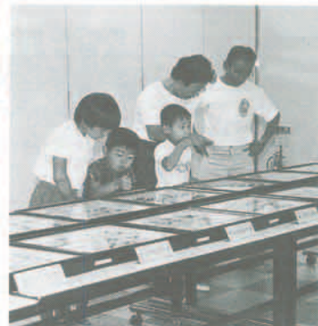
昨年のワクワク昆虫展

から、サビエ・ギャラリーでビデオを使用して昆虫の生態や種類などを学習します。 昆虫標本展示コーナー 世界各地に生息している昆虫や猪名川流域の昆虫など約千種類の標本を展示します。 昆虫の大好きな子どもたちも親子連れで一日、楽しんでみましょう。 詳しくは、教委社会教育課へ、(☎66-66000)