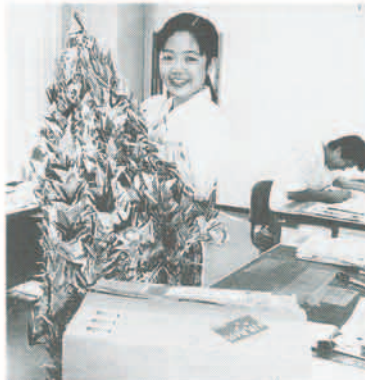
▲ 8月16日、昨年本町を訪れた、姉妹都市パララット市の女性教師から、児童に平和の尊さを教えながら折った千羽づるが届きました。