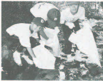
▲ 8月7日、万善地内で行われたラブリパーイナガワで約500人が、河川清掃や魚のつかみどりなどに頑張りました。