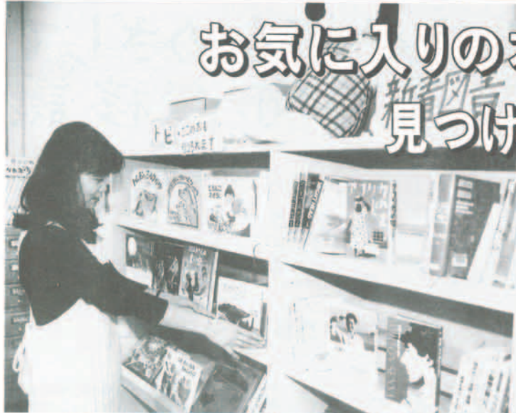
日生住民センター図書室に設けられている新着本及びトピックコーナー