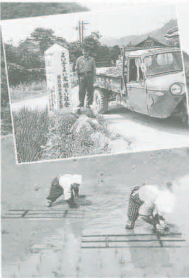
(上) ほとんど見かけなくなった三輪自動車 (下) 手作業に頼っていた昭和36年頃の田植