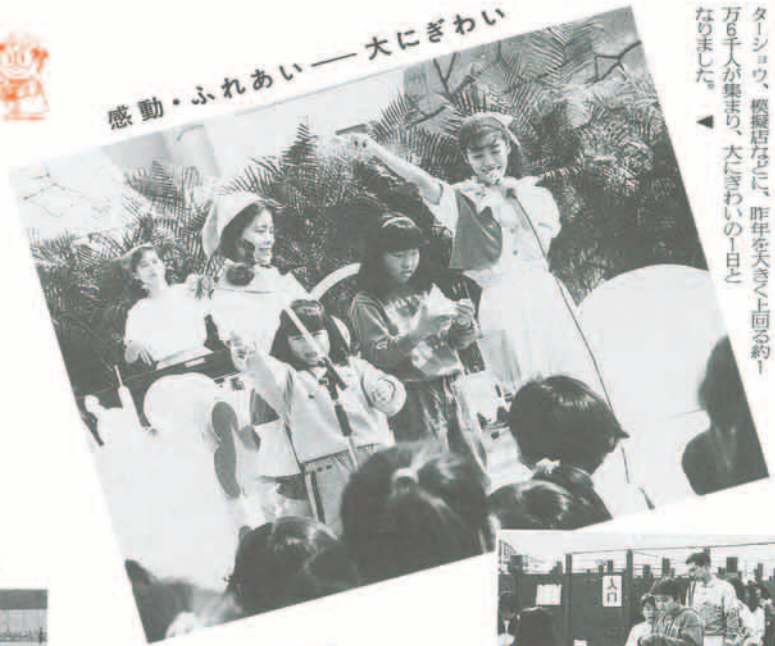
11月3日、総合公園とイナホールで「いながわまつり」が開催されました。当日は、各種展示やキャラクターショー、模擬店などに、昨年を大きく上回る約1万6千人が集まり、大にぎわいの一日となりました。