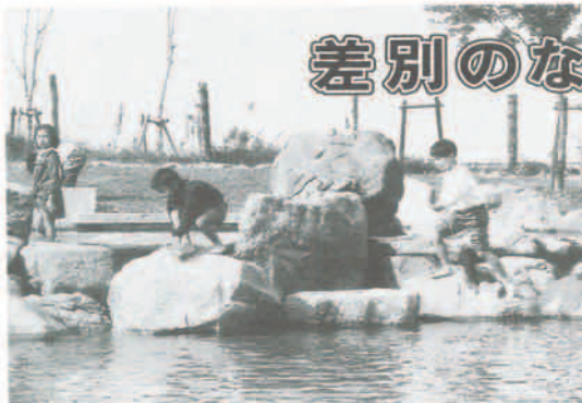
総合公園で元気に遊ぶ子どもたち