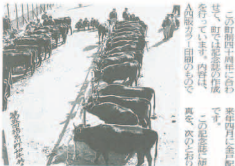
昭和35年頃盛んに行われていた牛の共進会