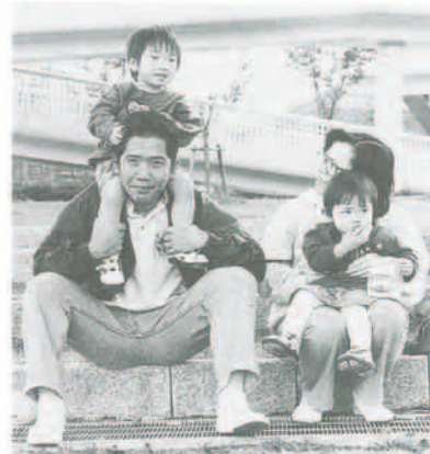
のびる飲食店が魚介類販売店にまかせて、おいしく安全に食べましょう。