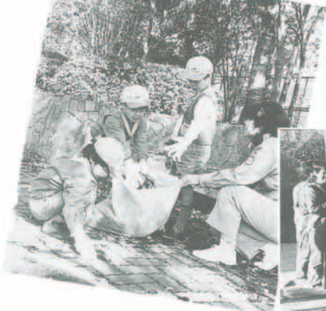
11月20日、町内全域でクリーンアップ作戦が行われ、45団体約6,522人が参加し、約21トンのゴミを収集しました。