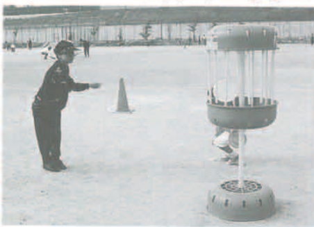
11月13日、猪名川中学校でふれあいの祭典が阪神地域スポーツ大会兼第4回町レクリエーションスポーツ祭が開催されました。当日は、秋晴れのもと約400人が集い、豚汁やせんべいのサービスに舌鼓をうちながら、観技を楽しみました。