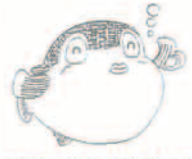
フグはおいしく安全に！

近年、フケによる家庭での中毒が多発しています。食へられるフケの種類と部位は決まっていますので、フケ調理は適正な処理