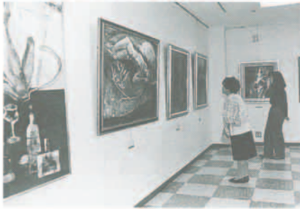
10月29日、11月6日の間、サビエキヤラリーで「猪名美展」が開かれました。期間中は、延べ約3千人が来場し、猪名川美術会の作品に見入りました。