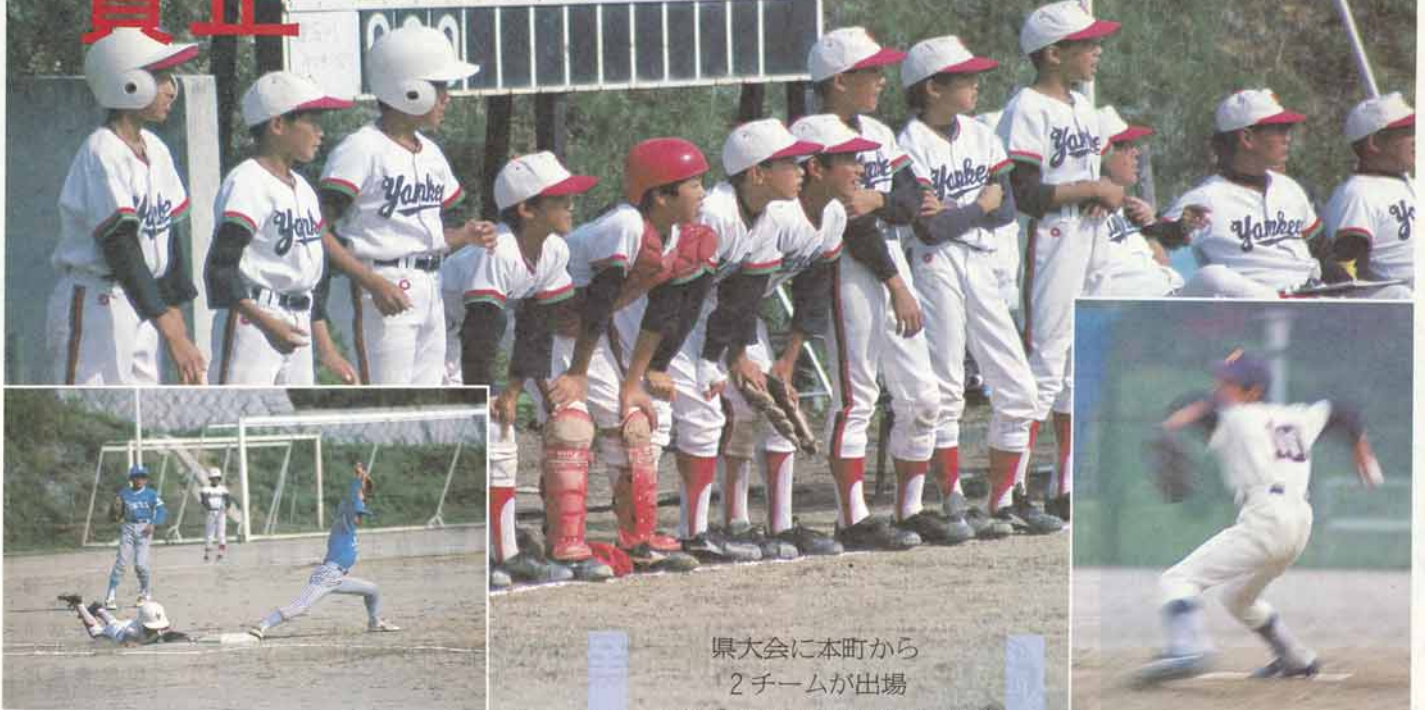
県大会に本町から 2チームが出場

県軟式少年野球秋季選手権大会が昨年11月に町スポーツランドで盛大に開催され本町からは、松小ベアーズと猪名川ヤンキースの2チームが出場しました。猪名川ヤンキースは、惜しくも2回戦で敗退、松小ベアーズは準決勝で惜敗しました。