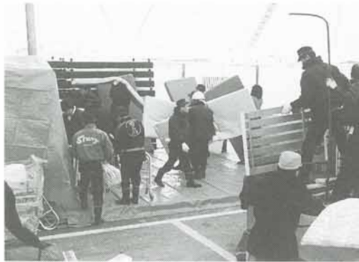
町内各消防分団員が参加して行われた救援活動

町消防団員が救援活動 二月十日から同十六日まで、県災害対策本部の要請に基づいて、町消防分団員が三木山森林公園（三木市）で救援物資受け入れ、搬送などを実施して、三百九十人が行いました。 また、町職員も同本部の要請によって、芦屋市で救援活動を随時行っています。