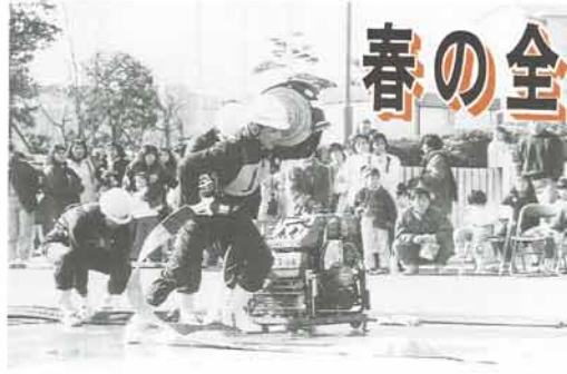
町消防出初式でポンプ操作を披露する消防団員

「安心の暮らしの中心 火の用心」をスロガーンに、三月一日から七日まで「春の全国火災予防運動」が展開されます。町消防本部では、この期間中に防火広報を中心とした啓発活動を行います。