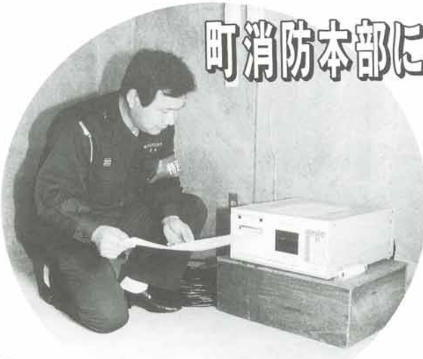
大阪管区気象台から臨時に消防本部へ設置された震度計

阪神大震災が発生してから約一ヵ月半が経ちました。阪神地域や淡路島、大阪府下を含む各地に大きな傷跡を残しました。本町も阪神間の一員として、県や被災地への救援活動を行っています。今後は、被災地への救援も含めて被災された地域の人の受け入れを行っています。 本町域を含んで、気象庁など関係機関では余震活動が続くが減少傾向と予想しており、大きな地震が発生したときは正確な情報によって、安全な場所へ避難できるように日頃から掛けましよう。