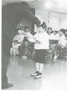
日生住民センターでの修了式

四歳の息子と交通安全教室に参加し、命にかかわる車の正しい乗り方や横断歩道の渡り方を、毎回紙芝居やゲームを通して楽しく学べました。横断歩道を渡る実習では、初めは危ない渡り方をしていたが、繰り返すうちに慣れてきました。