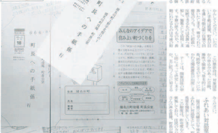
町長への手紙 (平成6年度内容明細)