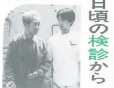
成人病検診日程表