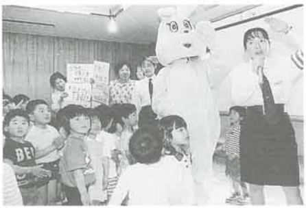
うさちゃんクラブ発会式

▲5月17・18日、平成7年度の幼児交通安全教室（うさちゃんクラブ）の発会式が日住市民センター、社会福祉会館の2カ所で行われました。発会式には協力が出席し、これから1年間みんなで交通安全について勉強します。