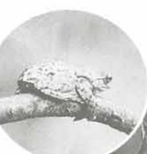
モリアオガエルが産卵