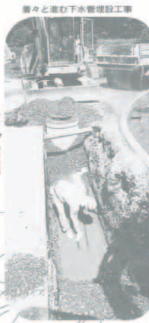
町々進む下水道建設工事

下水道の整備は、快適な生活環境をめざして進められています。下水道の整備は、快適な生活環境をめざして進められています。下水道の整備は、快適な生活環境をめざして進められています。