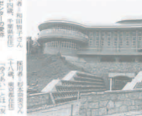
完成まで約1ヵ月の福祉センター（北田園地内）

福祉センターの食料供給者を募集しています。福祉センターの食料供給者を募集しています。福祉センターの食料供給者を募集しています。