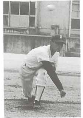
取材協力：猪名川高校野球部