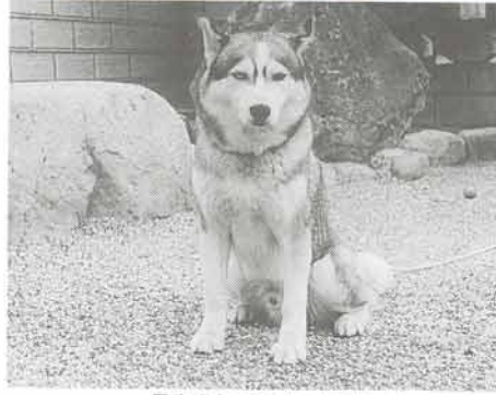
長生きしてよかったワン!

九月十五日に、川西猪名川医師会と県川西保健所が開く「かわにし・いながわ動物愛護祭」で表彰する長寿犬を次のとおり募集します。 【対象】13歳以上で元気な飼犬 申込みは住所、氏名、電話番号、飼犬の種類、年齢・性別・名前、簡単なエピソードを書き、犬の写真（キャビネ版・普通版各二枚）を添えて、八月十日（必着）までに川西保健所衛生課（川西市大町二丁目二二の八、☎五七・四三〇）へ。