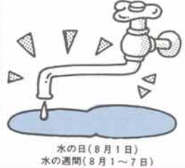
水の日（8月1日） 水の週間（8月1～7日）

▽募集人員 2名 ▽資格 20歳以上60歳未満の人で6カ月以上継続して勤務（3日に一度の交代勤務）ができる方 ▽賞金 日額9千円 ▽職務内容 夜間の中央管理所・浄水場の簡単な点検及び監視業務 ▽勤務時間 午後5時から翌日午前9時（仮眠・休憩時間を含む） 申込みは、市販の履歴書を含む十五日までに町水道課（六六・八七〇）へ。（郵送可）