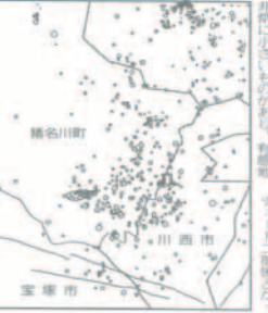
上の図は地震の発生状況を示しています。マルの大小は、マグニチュード、個のマルが1回の地震を示しています。

やっぴい 町民の生活や町政のありかたについて、町民の疑問や要望を、町長や町議が直接お答えするコーナーです。