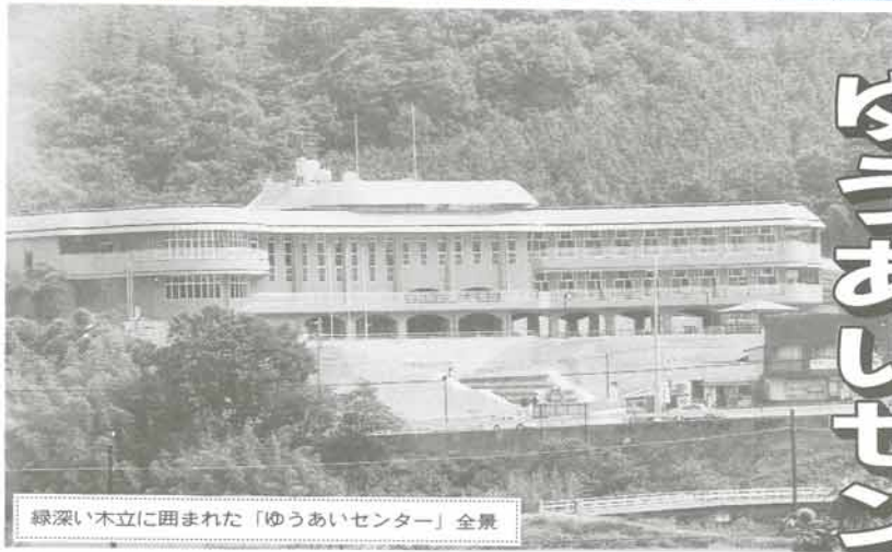
緑深い木立に囲まれた「ゆうあいセンター」全景