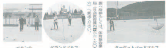
ベタンク グランドゴルフ ターゲットボードゴルフ

町民体育大会は、昔ながらの町民交流の場として、市民の健康増進を目的として開催する。 ▽参加費 各種目3名まで無料 ▽抽選は、文化センター・日生連 結祥・社会教育課に届け付け の用紙で10月5日まで社会教育