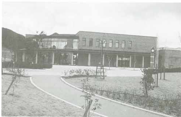
総合公園に完成した生涯学習センター 中には、図書館と中央公民館があり、生涯学習に利用できます

次に低年齢児童に関する多様な体制の充実を図るとともに教育課題に関する調査・研究や教育相談を行う専門機関の設置を行います。また週休二日制の定額労働時間間の短縮に伴い、住民のみなさんの自主的・主体的な活動や生涯学習の場を提供するため、生涯