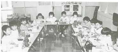
すこやかな毎日を送る子どもたち

来たるべき二十一世紀を五年後に控え地方公共団体の長としてその責任の重大さを痛感するとともに地方自治の本旨である「住民自治」と「団体自治」の理念に基づいて町政に全力で取り組みます。昨年の阪神・淡路大震災は忘れることのできない惨劇です。本町においても被災した阪神間の一員として、昨年から防災体制の再構築に向けて取り組みます。今後、災害に強いまちづくりをめざし、この震災で得た教訓を防災体制などに反映させるよう努め、広域的・組織的に迅速に対応できる体制づくりに取り組みます。また、この震災前から本町周辺で発生した群発地震