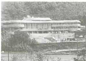
福祉施策の拠点ゆうあいセンター