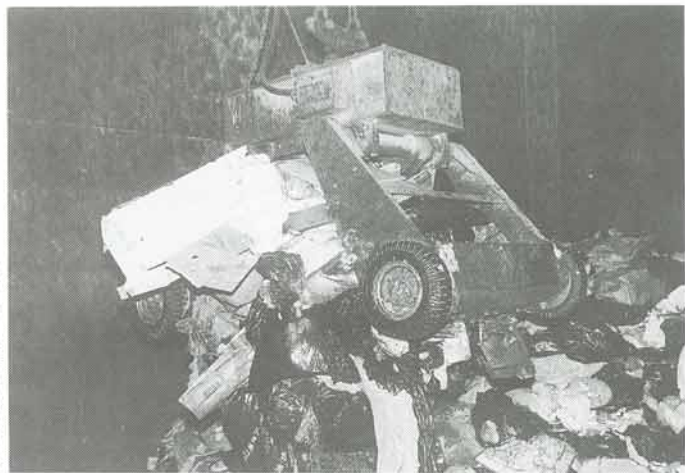
各家庭から出された可燃物（生ごみ）