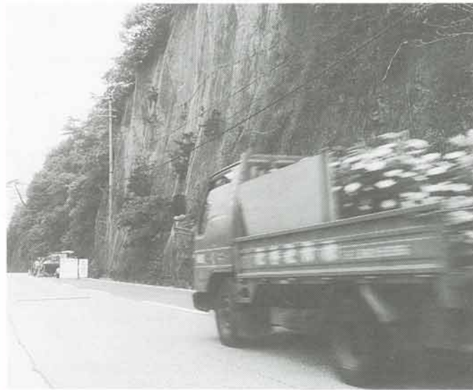
今年度防災工事中の斜面 (万善地内)

六月から七月にかけて梅雨の季節です。近年は、異常気象が続いており、集中豪雨などによる災害発生恐れが充分にあります。また、群発地震は今のところ沈静化していますが、油断は禁物です。梅雨を控えたこの時期、もう一度災害への備えについて考えましょう。 町では毎年防災会議を開いて、地域防災計画を策定し集中豪雨など災害に備えその発生恐れがあるときは、役場に災害対策本部を設置し、災害の未然防止に努めます。