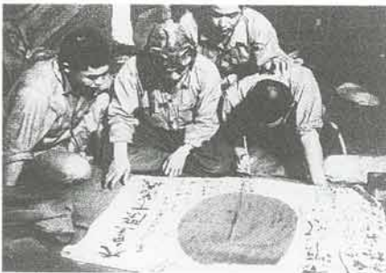
整備兵に感謝の寄せ書きを書く隊員

特攻隊展 太平洋戦争末期、沖縄決戦において特攻という人類史上類のない作戦で爆弾搭載の飛行機もろとも肉戦となり、一機一艦の突撃を敢行した特攻隊の関係資料を展示します。 今回展示するのは、知覧特攻平和会館（鹿児島県川辺郡知覧町）から借用した多くの特攻隊員の遺書、絶筆、手紙、寄せ書きなど四十点です。