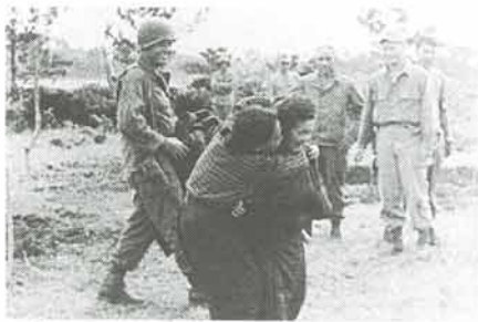
米兵に身柄を拘束され恐怖におびえる親子

ビデオ上映 太平洋戦争の決戦場となった沖縄では、日米双方で二十数万人が亡くなりました。中でも、沖縄住民の被害は大きく県民の四人に一人が命をおとしました。 今回上映するビデオは、アメリカ国立図書館に保管されている沖縄戦関係のフィルムを元に作成された「ドキュメント・沖縄戦」沖縄戦・未来への証言」の二本です。