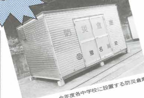
今年度各中学校に設置する防災倉庫

九月は、一年のうち最も多くの台風が来る季節です。この時期の台風は勢力も大きく、直撃を受ければ大きな被害が出ますので、気象台の予報には十分注意し、雨戸や排水など家の周りは一度家庭でチェックしましょう。 避難場所（一覧表のとおり）も事前に確認し、万一の災害に備えましょう。