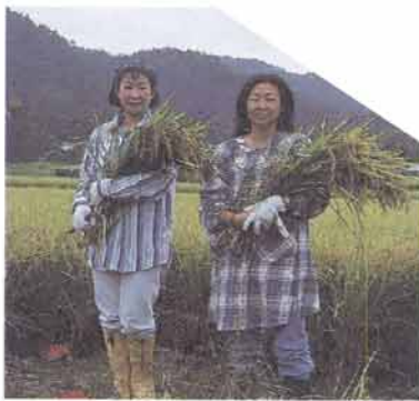
たわわに実った稲穂を手に稲刈り体験

その中でお米は私たちにとって一番大切な作物で、作付面積は、日本の農作物の中では一番多い量です。私たち特派員2人は今回、お米が出荷されるまでを実際にやってみようとして稲刈り体験をし、JA猪名川のライスセンターを訪ねてみました。