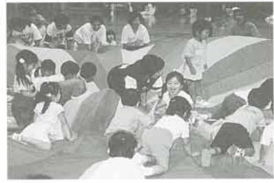
昨年の親子体操教室

▽とき 9月10日から11月19日までの10月22日を除く毎週木曜日 10時開演、午前10時・同日15分 ▽ところ 文化体育館 ▽対象 町内在住・在勤の親と幼児（平成9年に満3歳から5歳になる幼児）ただし、幼児1人につき保護者1人 ▽募集人数 40組（申込多数のときは抽選） ▽参加費 1組4千円（保険料を含む） ▽申込期間 8月1日～同月20日 申込みは、社会教育課、文化体育館、日生・六瀬住民センターに備え付け