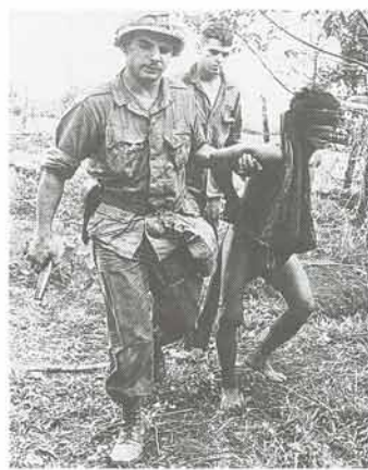
米兵に捕えられた少数民族の青年

とき 8月2日(土)・3日(日) 午前10時〜午後4時 ところ 生涯学習センター 問い合わせ 町長公室(☎66・8707)