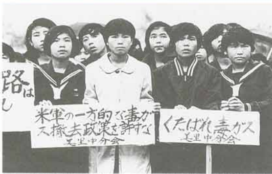
毒ガス移送に抗議して開かれた「命を守る校区民総決起集会」に参加する女子中学生

これまで経過 昭和二十二年三月二十六日の米軍の慶良間列島上陸に始まり八十日余りにわたる沖縄戦は、国内唯一の住民を巻き込んだ地上戦でした。沖縄戦は、「本土決戦の防波堤(捨て石作戦)」ともいわれ、戦死者は二十万人を超えました。 沖縄本島に上陸した米軍は、住民が収容所に入っている間に嘉手納飛行場や読谷飛行場、本部飛行場などを住民の私有地に整備し、何の補償もありませんでした。その後、米軍はたまた同然の安価な土地賃借契約を一方的に結び、それに反対した住民は高ぐるみの土地闘争を繰り返してまいりました。 米兵による交通事故、殺人、暴行など事件・事故が多発、米軍用地特別措置法(特措法)などによる賃借借契約なしでの用地の使用、知事の代理署名拒否、また、同法の改正による使用期限の延長など沖縄はさまざまな問題を抱えています。