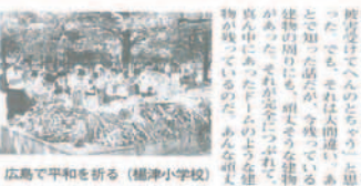
広島で平和を祈る (楊津小学校)

修学旅行に行こう 私は、修学旅行に行こうと、友人と相談しています。友人は、修学旅行に行かない方がいいと、私にアドバイスをくれました。友人は、修学旅行に行かない方がいいと、私にアドバイスをくれました。友人は、修学旅行に行かない方がいいと、私にアドバイスをくれました。