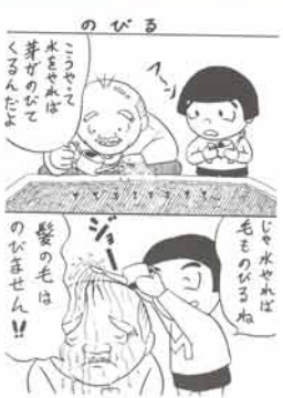
のびる こぼれて 水も水も 芽のびで くるんだよ 髪は毛は のびません!! 川根徹也さん(7歳 伏見台)