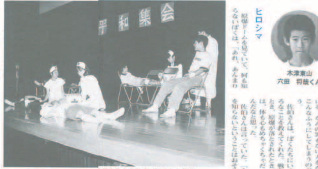
広島の原爆の恐ろしさ平和集会で熱演 (松尾台小学校)

こわくても、進め 日々の中、何事か知らずには、ぼくたちは生きています。平和を築くためには、お互いを理解し、尊重することが大切です。