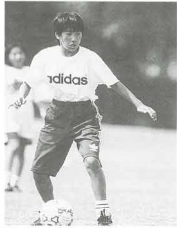
▲リーガー目指して練習にも熱が入る

スポーツマンらしい屈託のない笑顔で話してくださいました。わか町で、世界を舞台に活躍している選手がトレーニングしていると思うと、私たち住民みんな応援したい気持ちでいっぱいです。がんばれ、くるまじ」とエールを送ります。