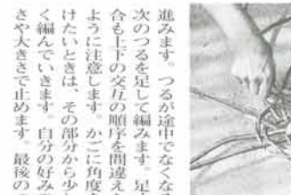
かごの作り方（写真2）