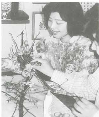
自然の素材をインテリアに

どんぐり、松かさ、しいの実、つばきの実、はんの実、かるかやなど、リースにする素材ならなんでも集めます。フラワーワイヤー、ボンド、工作用はさみ（花はさみ）を用います。集めた枝二本をワイヤーで組み、それを二、三組をあわせて土台になるリース台を作ります。松かさやどんぐりはワイヤーに巻きつけておき、しいの実などかさや実がバラバラになっっているものはボンドでくっつけておきます。土台につるなど大きいものから差し込んでいき、ワイヤーで