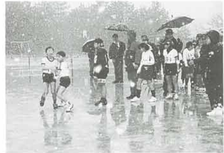
彫刻の道マラソン大会成績一覧(敬称略)