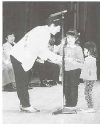
これからも守ろうね、交通ルール

「たすけてもらったこと」と、しんぱいなこで言いました。そうしたら、Aさんが「がんばれば、できるよ。まだ、れんしゅうなんだから。」と、Aさんが言いました。わたし