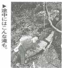
途中にはこんな滝も。

北摂最高峰 大野山(七五三峠) 猪名川町の北部には、北摂一の高さを誇る大野山(七五三峠)があります。山頂には、大野アルプスランドとしてキャンプ場などがあり、これからのシーズンには、多くの人が訪れます。 私たち特派員は、三月の少し肌寒い日に、「西幹井沢」バス停から登山道に入り、頂上までの約二・五キロを登ってきました。県道から〇・四キロ程入ると未舗装の山道になります。そこからは、落ち葉のクッションが足に心地よく、自然を満喫できます。途中に急な坂もありますが、登り始めて約一時間で頂上に着きました。頂上まで登ると、頬をなでる風や澄んだ空気に、何ともいえないすがすがしさを感じました。三六〇度見渡せる山頂からは、天気の良い日には、遠く大阪湾も見えます。帰りは、柏原方面へ舗装路をゆ