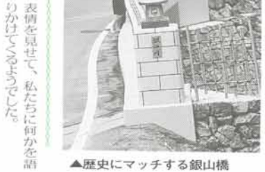
▲歴史にマッチする銀山橋

登山や散策をするときは、よけいなことなど考えずに気軽に楽しみたいもの。でも、素晴らしい景観をいつまでも残し続けるためには、決まりきったことですが、次のことを守って、より楽しいものにしましょう。 ○自分のゴミは自分で持ち帰りましょう。特に山火事の原因となる、タバコのポイ捨ては厳禁です。 ○緑を大切に、花や木は持ち帰らないようにしましょう。 また、さほど高くない山でも、意外にお天気が変わりやすいので、雨具の用意も忘れずに。