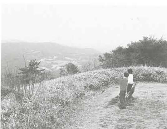
▲360度見渡せる大野山山頂。晴れた日には大阪湾まで見えるそうです。写真で見えているのは「関西軽井沢ゴルフクラブ」

すっかり春です。今月末からは、ゴールデンウィークが始まります。重いコートを脱いで、さっそうと外へ出かけたいところです。連休を活かして遠出するのでもいいですが、身近な猪名川町内をのんびり歩いて、自然や町並みに触れてみませんか？