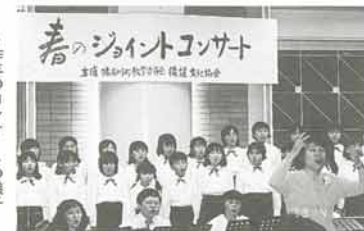
▲昨年のコンサートの様子

猪名川混声合唱団リバーコールとイナウインズによるジョイントコンサートを開催します。「希望」「世界は二人のために」などのおなじみの曲から、「もののけ姫」「だんご三兄弟」など子ども向けの曲まで美しいハーモニーをお楽しみください。 ▽5月22日(土)午後7時～ 問い合わせは、社会教育課(☎67-2600)へ。