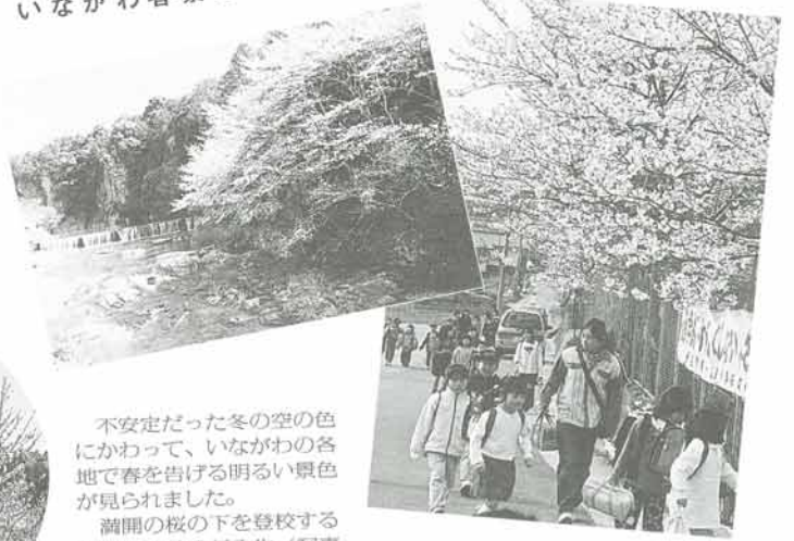
不安定だった冬の空の色にかわって、いながわの各地で春を告げる明るい景色が見られました。