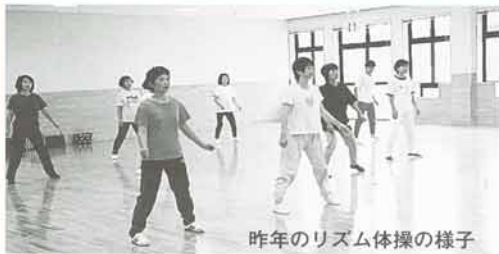
昨年のリズム体操の様子