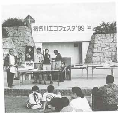
地球環境は、みんなの問題…。10月10日、総合公園で、商工会の主催による「猪名川エコフェスタ'99」が開催されました。 エコロジーに関するクイズや、参加者が持ち寄った品物によるフリーマーケット、オークションが行われ、多くの人に環境問題への関心を持ってもらうよう様々なイベントが行われました。