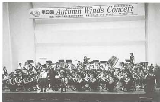
町内3中学校の吹奏楽部による合同演奏会「オータム・ウィンズ・コンサート」が、10月10日、イナホールで1,000人を超える聴衆を集め開催されました。いずれも実力派の各中学校に、卒業生や客演など多彩な演奏が加わり、聴き応えのあるコンサートとなりました。