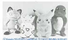
▲ポケットモンスターショー