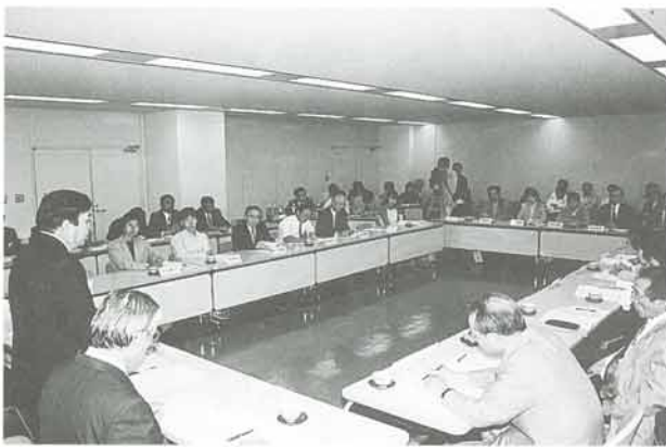
▼検討委員会で慎重な討議が行われた