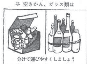
☆ 空きかん、ガラス類は