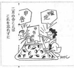
二月の合点はこの忘れずに

所得は、みなさんの収入から、所得税(個人町民税)の申告の受付がはじまります。申告の受付期間は三月十日(火)までです。所得税の確定申告は、重なる町民税の申告も同時に提出する必要があります。町民税の申告は、町民税課に提出してください。町民税の申告は、町民税課に提出してください。町民税の申告は、町民税課に提出してください。