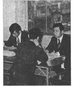
期間短近になると混雑します(昭和51年町役場で申告)

二月十六日(金)から、所得税(個人町民税)の申告の受付がはじまります。申告の受付期間は三月十日(火)までです。所得税の確定申告は、重なる町民税の申告も同時に提出する必要があります。町民税の申告は、町民税課に提出してください。町民税の申告は、町民税課に提出してください。町民税の申告は、町民税課に提出してください。