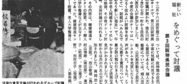
活発な意見交換が行われるグループ討論

出ぞめ式は、町民の生活に大きな影響を与えます。出ぞめ式は、町民の生活に大きな影響を与えます。出ぞめ式は、町民の生活に大きな影響を与えます。出ぞめ式は、町民の生活に大きな影響を与えます。出ぞめ式は、町民の生活に大きな影響を与えます。