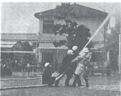
猪名川小学校の火災避難訓練