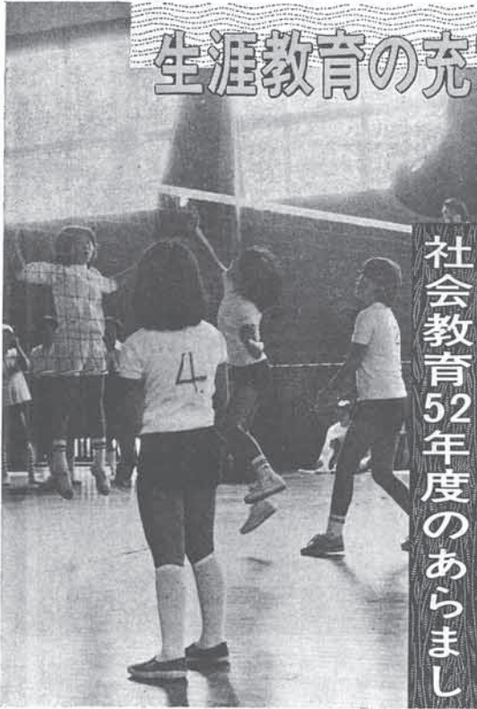
(少女バレーボール大会)

猪名川町教育委員会は、昭和52年度の社会教育基本方針を「生涯教育の充実」に骨子を置き、「和の町づくり」を推進しようと、このほど年間計画を発表しました。 そこで、みなさんに今年度の社会教育のあらましをお知らせしよう。