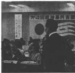
第4回阪神県民会議が盛況で開かれた。写真は、上野自治会。

第四回阪神県民会議が十九日(土)朝八時、上野自治会(上野町)で開かれ、約二百人が参加した。上野自治会が中心となり、各市町の代表が参加した。会議は、上野自治会が中心となり、各市町の代表が参加した。会議は、上野自治会が中心となり、各市町の代表が参加した。