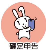
確定申告 (2024年度より)