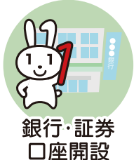
銀行・証券 口座開設