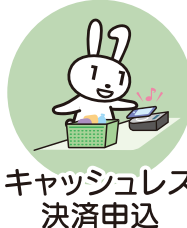
キャッシュレス 決済申込