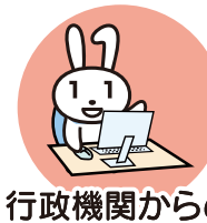
行政機関からの お知らせ・各種証明書