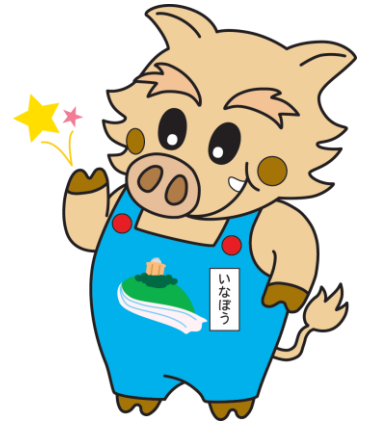
猪名川町のマスコットキャラクター「いなぼう」