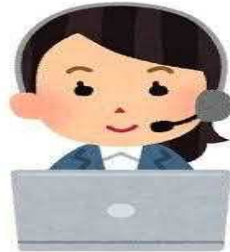
川西市医師会 川西市・猪名川町 在宅医療・ 介護連携支援センター