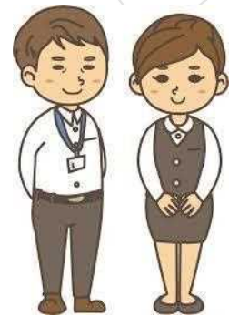
地域包括支援 センター