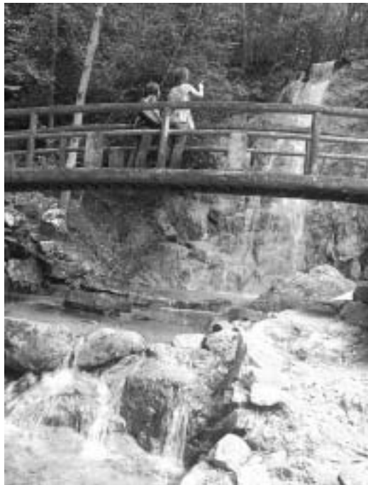
鎌倉地区不動尊の滝

町の環境の現況や環境への負荷の状況及び住民、事業者の取り組み状況などを把握し、環境基本計画の進捗状況とともに公表します。