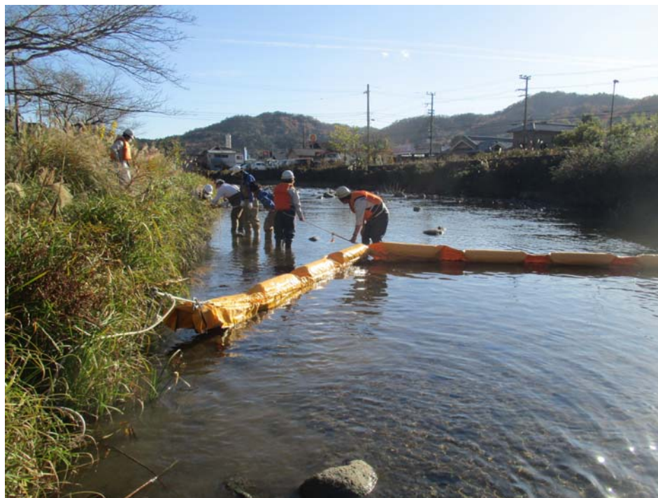
油流出事故を想定したオイルフェンス敷設訓練（笹尾浄水場前）

水質検査は、水道水が水質基準に適合し、安全であることを保証するために不可欠なものです。水質検査計画とは、適正な水質検査を行なうために水質検査の方法や項目等を定めたものです。