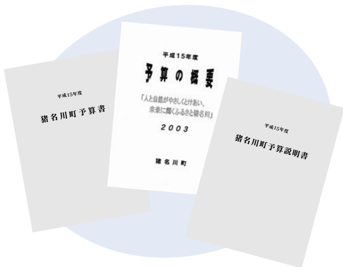
3月定例議会において審議された予算