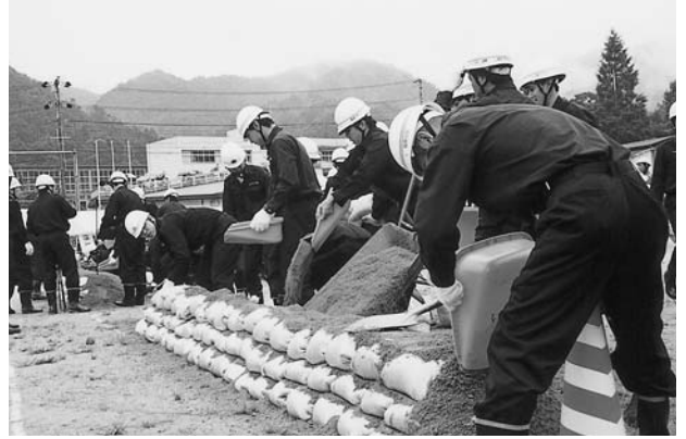
消防団による土のう工法訓練

教育次長 多くの情報を持つ新聞を授業に活用することは意義がある。NIEの活用・推進を図りたい。