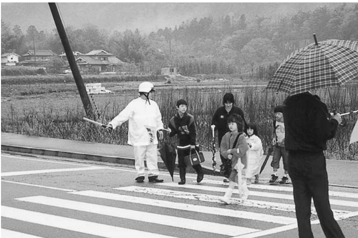
元気な登下校に地域の目を

通災害、誘拐等が危惧され、小学校3年～4年にもなると活動圏も広がり学習塾通いもある。教育委員会及び学校としての取り組みは。 教育次長 登下校時の安全確保は各校において、PT Aや地域の協力のもとに指導しており、防犯ブザーの携帯や110番のおうち、町公用車約70台の町内業務走行等は一定の抑止力になり、地域と連携して子どもたちの安全確保に努める。