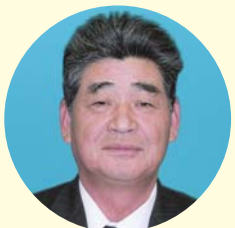
切通 明男 議員