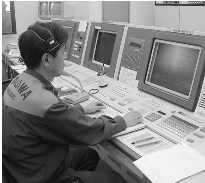
緊急通報システムの受信センター（消防本部）