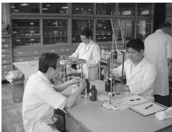
薬剤師による水質検査