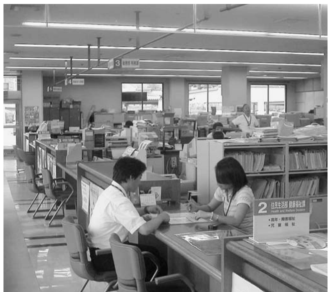
役場1階での窓口対応の様子

でき、申請↓交付↓手数料の支払いも移動なしで行える、ワンストップサービスを目指すべきではないか。 企画部長 総合案内窓口を設置し1年余りとなるが、今後はフロアーマネージャー的働きを行うなど、積極的に親切丁寧な対応をこころがけるよう指導する。 ワンストップサービスについては、人員配置や業務スペースの制限があり具体化に至っていないが、来庁者の一層の利便性向上を目指し改善に取り組む。