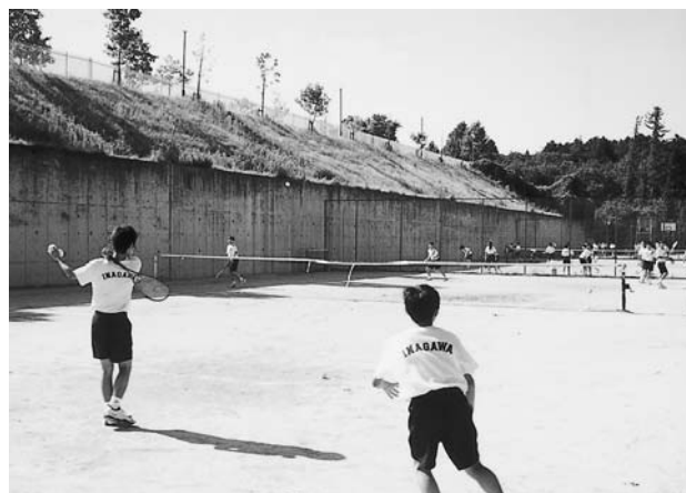
部活動に励む中学生

環境経済部長 困難な状況が生じていることは理解するが、現状では困難。課題・問題点の検証から始める。