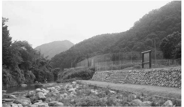
大島であい公園の親水施設

問 昨今、健康のために歩く人が増えている。猪名川の河川敷を地道のまま整備して、散歩やサイクリングのできる遊歩道にしてほしい。「大島であい公園」や、ふるさと館に親水公園ができる。道の駅の裏にも親水施設ができる予定だ。これらを遊歩道という線で結び、今後は町の玄関の日生に向かって、親水施設を何箇所か作り、川の駅を命名し、四季折々の自然を楽しむ遊歩道として阪神間の名所にする取り組みとして、水