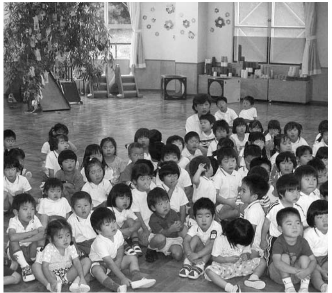
「就学前教育と小学校教育の連携」が望まれる

教育長 今回、猪名川町が、兵庫県の地域指定を受けて、幼児教育（幼稚園・保育所）と小学校のスムーズな接続を図る「就学前教育と小学校教育の連携」につ