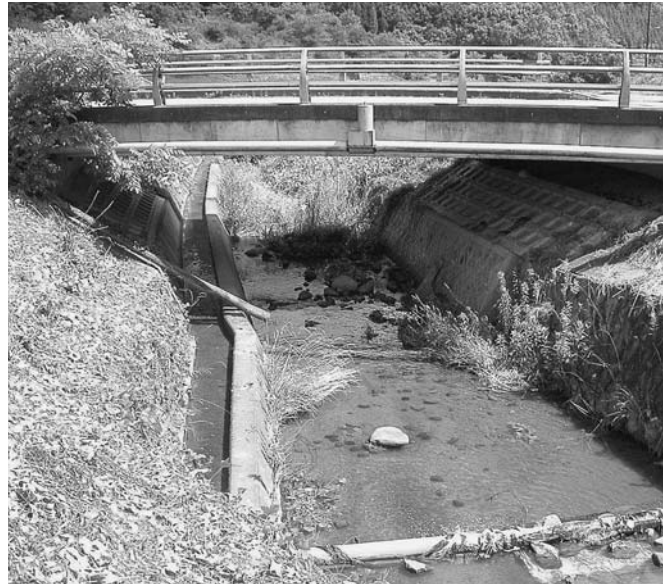
阿古谷川の周辺管理は