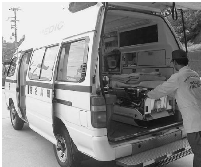
救急医療体制の充実が求められる