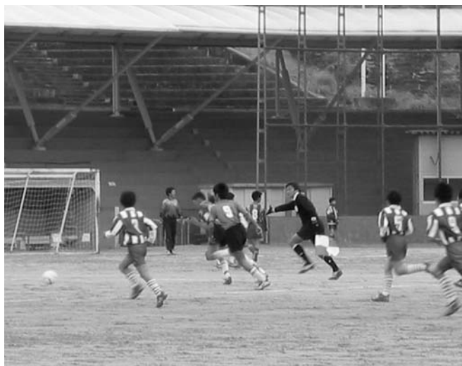
多目的に利用されているグラウンド

今後、自治会等の地域活動や、スポーツクラブ21の活動が増える中、どのような対応を考えていくのか。 教育次長 現在、競技スポーツ・生涯スポーツなど19種目、3,100人が活動している。財政難のとき、グラウンドや体育館の必要性は感じるが、新たな施設の建設は難しい。運用の中で年間を通じての利用調整、特に重なる土・日など