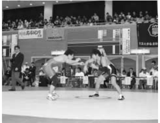
本町で開催された「全国大学レスリング選手権」

問 本町で来年に開催される国体のリハーサル大会として「全国大学レスリング選手権」がイナホール及び仮設会場で開催された。各種団体・一般住民・学生・職員が多数動員され大会をアシストしたが、国体本番に向けての反省点を検証する。 ・総勢何人に協力依頼し、職員もボランティアか。 ・町費の支出額は。 ・町内商工業者への業務発注などの経済効果は。 ・国体準備室は生涯学習課でなく企画部では。 ・反省会での意見を踏まえ今後の対応は。 教育部長 約1,000人の協力を得、職員の活動はボランティアではない。町費の支出は約5千万円で、仮設建築物・設備工作・備品・食糧・宿泊などが発生したが、今大会は経済効果を主眼に置いていない。また、競技の振興を図る意味で担当を生涯学習課とした。 助役 多くの反省点を検証し本番に生かしたい。 町長 経済効果を得るためにも地元商工業の皆さんにも力を付けてもらいたい。