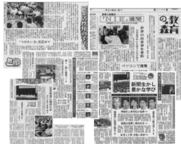
各地で取り組まれているNIE

問 食育や地産地消の考え のもと、米粉を使った給食パンを町内で作ることはできないか。 教育部長 地元の米からできたパンを地元で焼いて子ども達に届けることは、食育基本法の理念とする「心と体の健康づくり」に大変効果があると認識している。米粉パンの導入については全体から見ても前向きに考えていきたい。