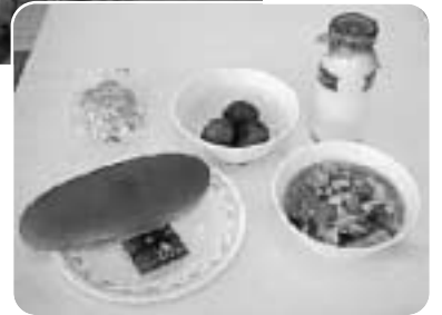
地産地消でおいしい給食を

問 食育や地産地消の考え のもと、米粉を使った給食パンを町内で作ることはできないか。 教育部長 地元の米からできたパンを地元で焼いて子ども達に届けることは、食育基本法の理念とする「心と体の健康づくり」に大変効果があると認識している。米粉パンの導入については全体から見ても前向きに考えていきたい。