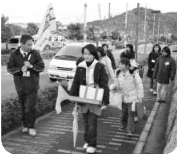
付添い下校の様子

問 子どもたちの安全・安心対策は。 教育部長 不審者情報はメールやファックス、防災ネットにより即時に学校・園、関係機関に周知する情報共有システムとネットワークを整備し、学校では一斉下校、付添い下校、集団下校、複数下校など事案に応じた対応策を講じている。生活環境課と教育委員会が連携し、川西警察、学校・PTA、自治会などの連絡組織を構成。短期・中期・長期にわたり有効な手立てを検討し、行動に移している。