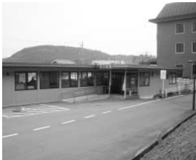
水道庁舎建設予定地

答 仮設で建てるよりこの際一元化し、基金を使って建設する。 伏見台にコミュニティ施設を町長3期目中に実現せよ 問 5年に伏見台自治会あけて集めた署名を町に提出。町長1期目の公約でもあり3期目中に実現せよ。 企画部長 地域も急速に高齢化し、土地利用も考え実現に向け努力する。 問 町長3期目に公約したNPO等に経済支援は。 企画部長 参画と協働、行政とNPO等是对等の立場であり、今後検討する。