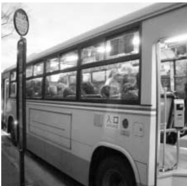
路線の増便が望まれる

企画部長 早い段階で実現するよう、協議・申し入れを行っていく。つつじが丘への増便は、入居状況を見極めて申し入れたい。