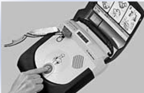
公共施設等に導入が計画されるAED