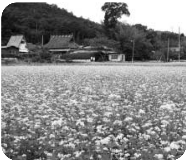
自然豊かなまち「猪名川」（概並）

今こそ英知を結集し、特区認定など他市町にない本町の良さを見直し自信ある町づくりや、阪神間における自然との共生は。 企画部長 地方分権が推進され未だ不透明な点があるものの、国の三位一体改革により従来の中央集権から権限も含め地方に事務が移行され、それぞれの地域の特色を生かしたまちづくりが可能となる。自分達の地域のまちづくりは自分達の手で行い、住民・行政が意思疎通を図り、行政運営を行うことが重要。